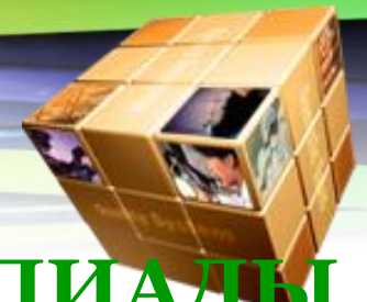
ГРАФИК ПРОВЕДЕНИЯ ОЛИМПИАДЫ 1 неделя