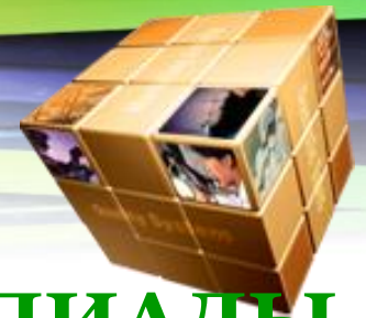
ГРАФИК ПРОВЕДЕНИЯ ОЛИМПИАДЫ 3 неделя