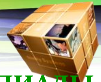
ГРАФИК ПРОВЕДЕНИЯ ОЛИМПИАДЫ 2 неделя